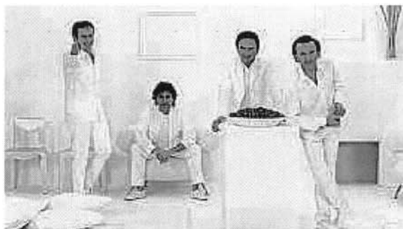
I Pooh. Oggi si può chattare sul loro sito